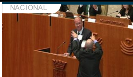
Expulsan a un exdiputado de IU por tirar billetes falsos a Monago