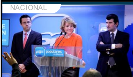
Aguirre pide a Wert acabar con la "neolengua de ideólogos socialistas" y "recuperar el castellano"