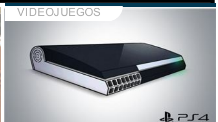
Recrean el diseño final de PS4 con las imágenes del borroso tráiler